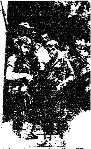
مقتلون فلسطينيون - وزعمور في قومه بنديهم